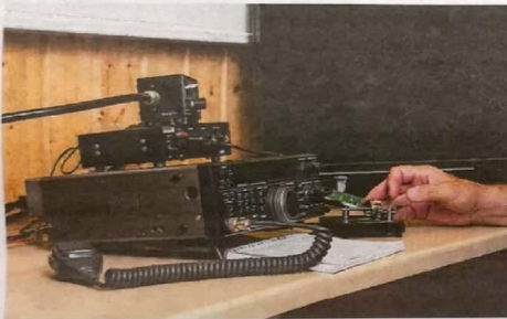
Kerhossa saa opastusta myös radioamatööriharrastukseen.

Kurssin tavoitteena on antaa valmiudet Viestintäviraston määrittämien radioamatöörin perusluokan turtuntoon, joka oikeuttaa käyttämään radioamatööriasemaa lähettämiseen. Lisäksi kurssi antaa valmiuksia rakentaa radioamatööritoiminnassa käytettäviä laitteita. HÄSA