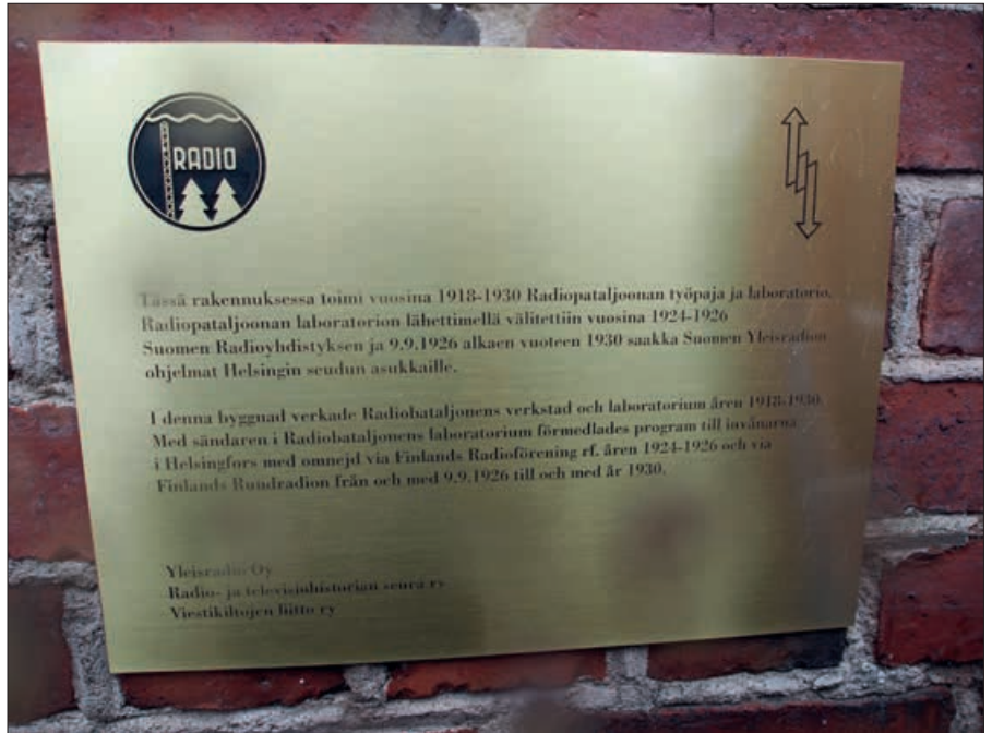
Kuva Radiopataljoonan muistolaatasta.