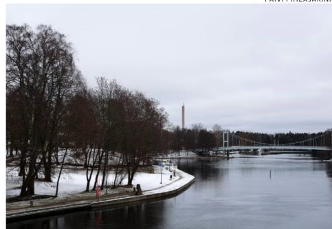
Lepänkorvan puiston ja Putaansillan maisema Valkeakoskella 17. marraskuuta 2023.