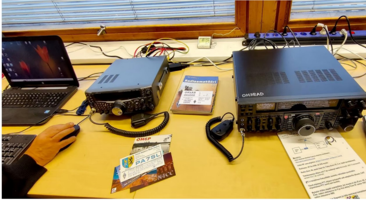
Valkeakosken radioamatööreillä on Valkeakosken linja-autoasemalla kerhotila, josta löytyy radiolaitteita ja muuta harrastukseen liittyvää, kuten muilta yhdistyksiltä saatuja kortteja.