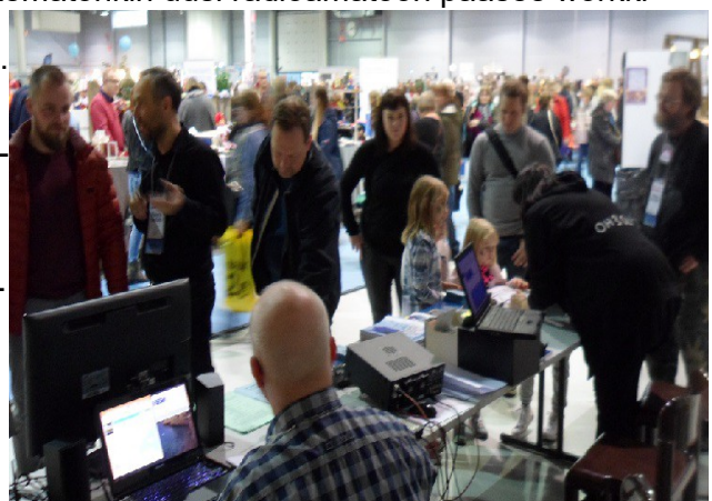
Kalevi, OH3NAO; ja etäasema Kätevä & Tekevä-messuilla

Kaikkia kerhon kävijöitä ja vierailijoita pyydetään merkitsemään käyntinsä vieraskirjaan!