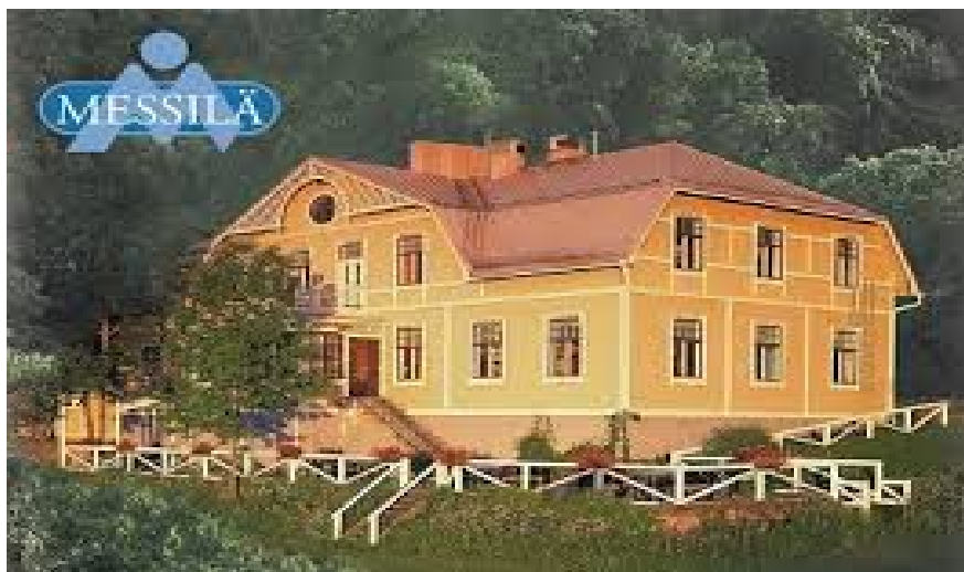
Messilän Kartanoravintola hiihtorinteen kupeessa

KORKEAN PAIKAN LEIRIN 2019 OHJELMA, KIRPPUTORI JA VIIHTYMISPALVELUT MESSILÄN KARTANOLLA JA HOTELLISSA PE-LA-SU 20.-22.9.2019