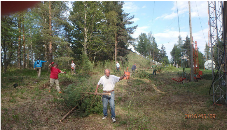
Kuva: Vesakonleikkuuta Vanhan Radioaseman takana.

- Toukokuussa järjestettyyn vesakkotalkookerhoiltaan osallistui ilahduttava määrä kerholaisia, joten metsää kaatui pois mastomaiseman, antennien ja tukilankojen tieltä vauhdilla. Talkoita jatkettiin myöhemminkin Alexandran, OH3MN/YL auttamana niin, että Radiomäki on nyt museoalueeltaan taas puistomaisessa kunnossa. Museon luvalla järjestettyyn talkoosaunaan Vartiotuvalla ei yhteensattumien vuoksi montaa kerholaista osallistunut, mutta naiset saunoivat siitakin edestä.