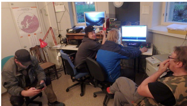
Kuva: Kerhoyönä oltiin ja workittiin

keittäjiä ei tänä vuonna "kerätty" listalle vaan yleensä ensimmäinen paikalle tullut laitto kahvit päälle. Pullaa ja mutta naposteltavaa oli aina saatavilla.