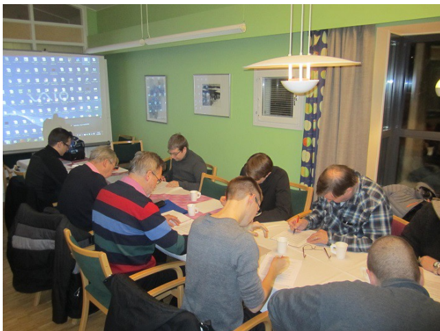
Kuva: Kirkkonummella paikallisen kerhon OH2ET kanssa pidetylle kurssille osallistui 11 henkeä

Kerhon koulutusmateriaali ja osa kouluttajista oli myös käytössä Kirkkonummella, Kirkkonummen Radioharrastajat Kissan Kipinä ry., OH2ET; jär-