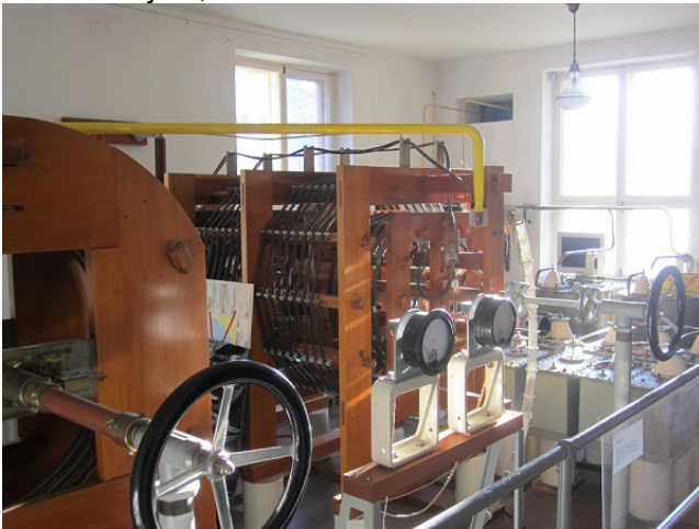
Kuva: Museon antennihuone vastavalossa