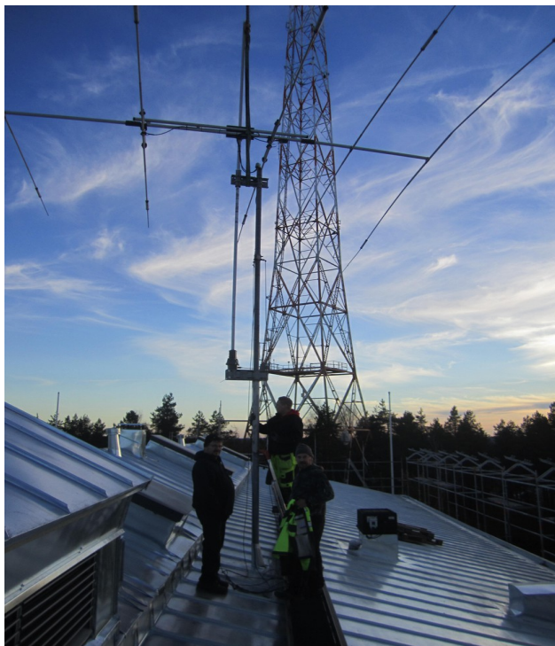
Kuva: Museon antennit nousivat takaisin katolle

https://www.youtube.com/watch?v=EJBHCibhIKY