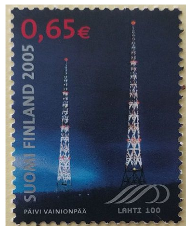
Risto Harjulan, RHA; arkistosta upea "Lahti 100"-postimerkki vuodelta 2005

Eduskuntaan ainakin kolme radioamatöörimielistä