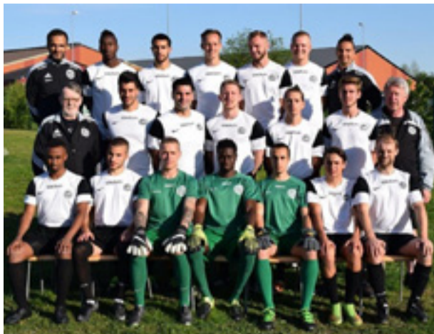
Årets trupp – den som tog FC Järfälla tillbaka upp i fyran. Laget släppte bara in 16 mål och säkrade seriesegern i näst sista omgången.